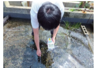
水質調査 (左: 河川、右: 養殖施設)