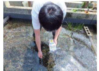
水質調査 (左: 河川、右: 養殖施設)