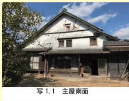
写 1.1 主屋南面