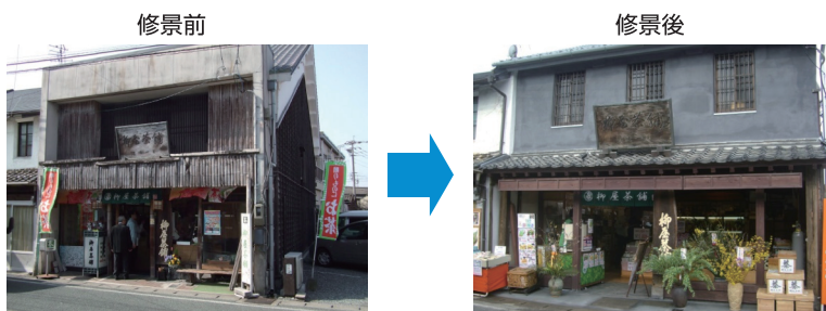
修景改修 (玉名市高瀬)

近年、まちづくりやむらづくりの話題には事欠かない状況にありますが、目先のことだけを優先したものは長続きしないし、なかなかうまくいっていないように思えます。“地域”の構造(変わらないもの)を踏まえたうえで、その手法を考えていきます。