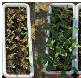
無投与群 光合成細菌投与群